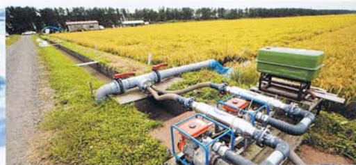
秋田県大湯村のビッグポール米