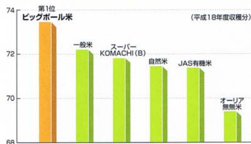
[秋田大湯こまち代表種食味値(栽培区分別)]

生産物に込めた豊かな生育と実りへの願い。作り手の気持ちでビッグポールがお手伝いします。